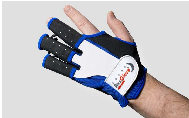
FixxGlove® classic plus