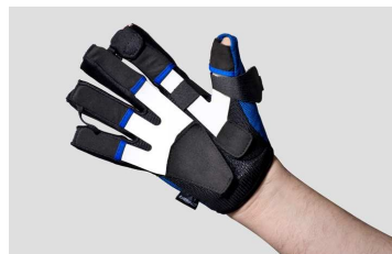
FixxGlove® V super plus