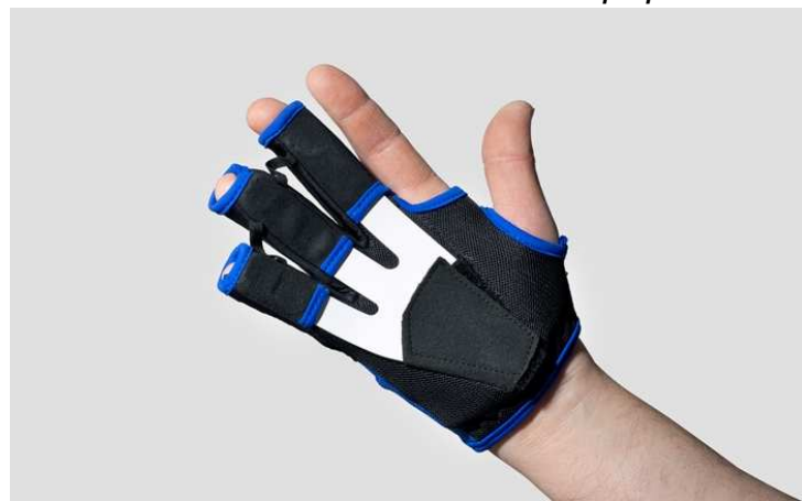
FixxGlove® super plus

De eerste comfortabele nachtsplint bij de behandeling van de ziekte van Dupuytren